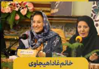
خانم غاداه یجای