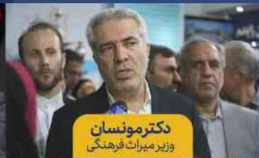
دکتر مونسان وزیر میراث فرهنگی