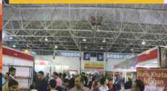
سالن صنایع دستی نمایشگاه بین المللی اصفهان