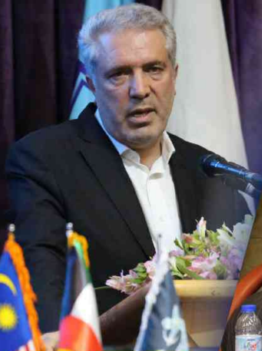
دکتر مونسان وزیر میراث فرهنگی