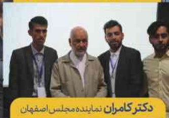
دکتر کامران نماینده مجلس اصفهان