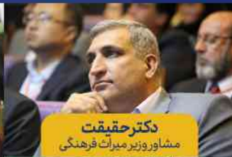
دکتر حقیقت مشاور وزیر میراث فرهنگی