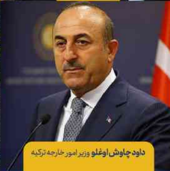
داود چاوش اوغلو وزیر امور خارجه ترکیه