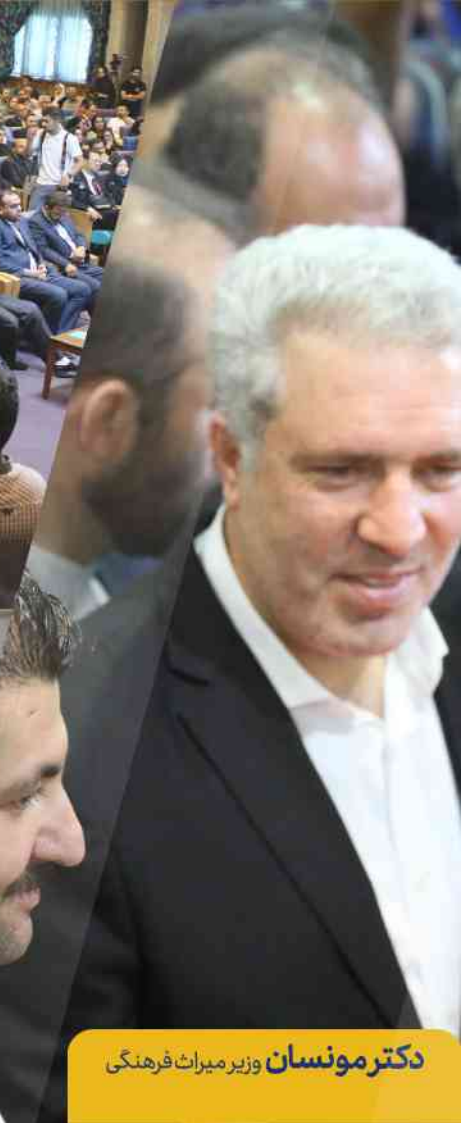
دکتر مونسان وزیر میراث فرهنگی