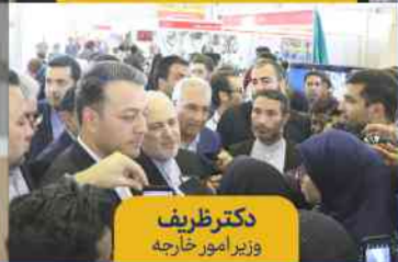
دکتر ظریف وزیر امور خارجه